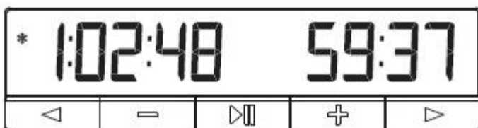
Slika 2 Time running mode / Odbrojavanje

Kada se sat pokrene, početi će odbrojavati na strani gdje je poluga podignuta. Kada igrač završi svoj potez, mora gurnuti polugu prema dolje. Kada se to dogodi, druga strana ima polugu podignutu i njihov sat počinje odbrojavati. To će se nastaviti dok bilo kojeg strana ne dosegne nulu.