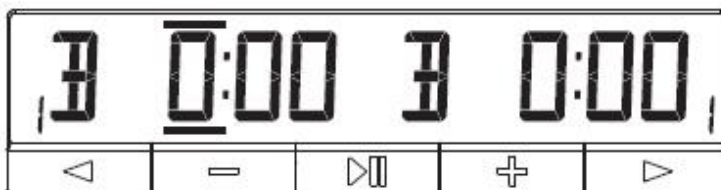
Slika 5 Bonus

Trake trepću iznad i ispod znamenke koja je trenutno odabrana. Pomoću gumba plus i minus možete urediti vrijednost znamenke. Pritiskom na gumb sa strelicama pomaknuti ćete se na sljedeću ili prethodnu znamenku. Promjene učinjene na lijevoj strani sata automatski se primjenjuju na desnu stranu. Ako želite napraviti asimetričnu postavku, prvo uredite lijevu stranu, zatim promijenite vrijeme na desnoj strani. Na posljednjoj znamenki zaslona, pritiskom na gumb sa strelicom desno premjestiti ćete se na sljedeći zaslon.