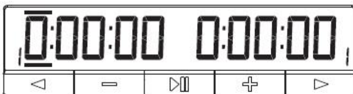
Slika 4 Ručne postavke

specifične za opcije kao što su bonus, odgoda ili Byo-Yomi razdoblja također se mogu prilagoditi.