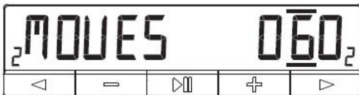
Slika 6 Brojač poteza